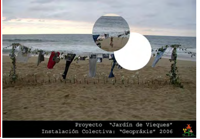
Proyecto "Jardín de Vieques" Instalación Colectiva: "Geopraxis" 2006